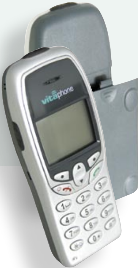
Das Vitaphone Cardiosystem